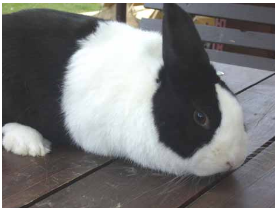
1,0 Holandský černý B 902, 3.6.30 - oceněn 96,5 body.

Tato výstava byla opravdovou přehlídkou holandských králíků, jak do počtu vystavených zvířat, tak i do kvality.