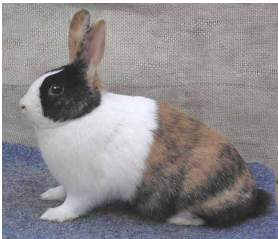
0.1 4-6 S-6 Holandský japanovitý 93,5 b., chovatel Ondřej Kabeláč