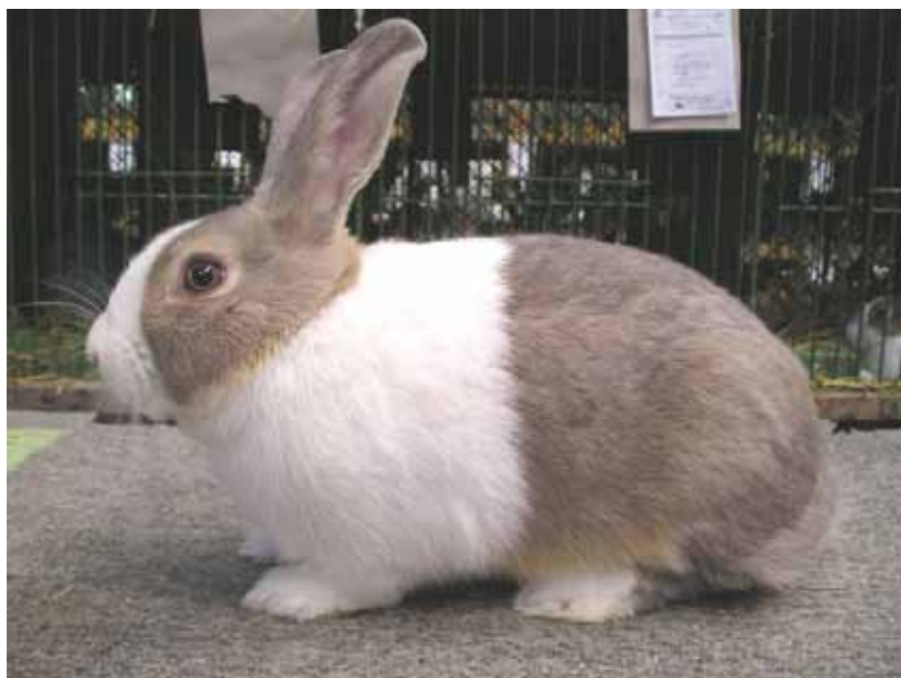
0.1 3-6 S-4 Horys 94,5 b. chovatel Roman Vácha