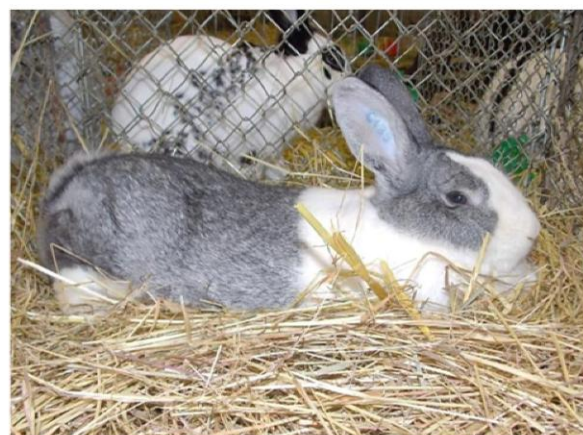
Hoči Anja Leibold 0,1 96,5 b.