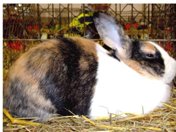
Hoj Rene Gewohn 0,1 95,5 b.