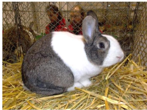
Homa 0,1 96 b. Wolfgang Emmerich Mistr SRN